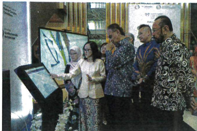
DR. DZULKEFLY (tiga dari kiri) diberi penerangan mengenai kerjasama strategik yang dimeterai antara KPJ Healthcare dengan Mayo Clinic.

Pacu kecemerlangan, tingkat piawaian baharu dalam industri penjagaan kesihatan