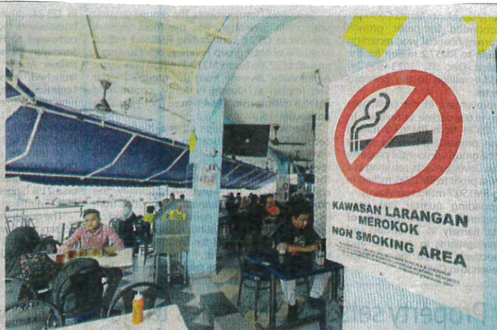
Designated smoking areas play a crucial role in deterring non-smokers, especially minors, from adopting the hazardous habit.

Heated tobacco products have gained popularity among the public in