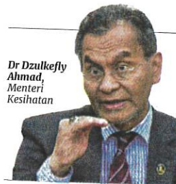
Dr Dzulkefly Ahmad, Menteri Kesihatan

Setakat 31 Disember 2023, sebanyak 6,480 daripada slot ini telah diisi dan bakinya akan diisi menerusi urusan pengambilan kontrak pada tahun 2024.